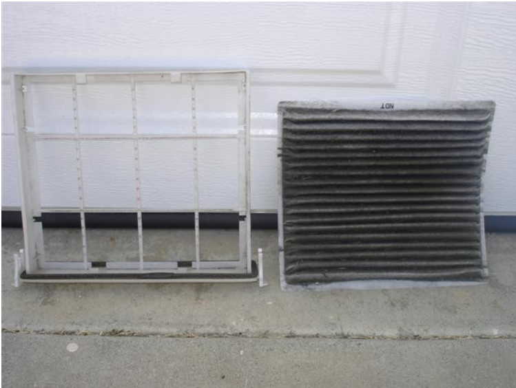
Die schmutzige Filtermatte wird vorsichtig herausgenommen ...