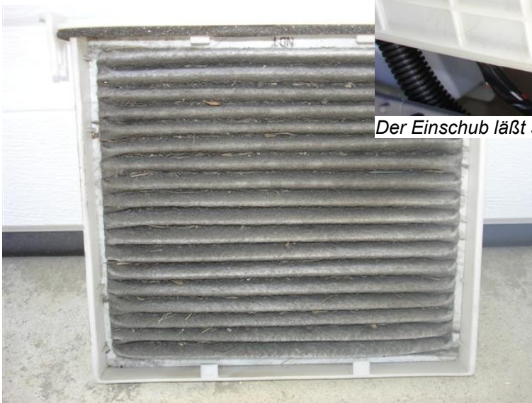
... und gibt das verschmutzte Filterelement frei.

Der Inhalt dieses Memos findet sich online unter http://rav4faq.kerkerinck.de/db71.html © Stefan SPRICKMANN KERKERINCK - Revision 3 vom 18.07.2006 18:28:16