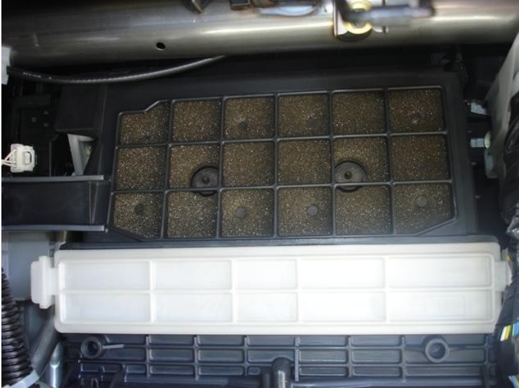
Das Filterelement befindet sich in dem weißen Kunststoffkasten