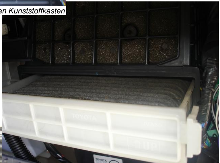
Der Einschub lässt sich herausziehen ...